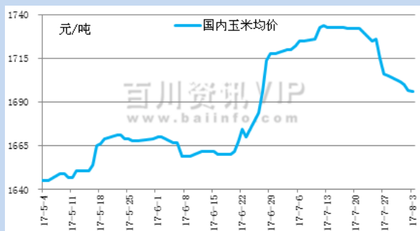
国内玉米港口价格走势: